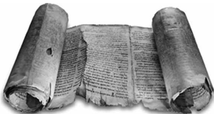
Libro en rollo.