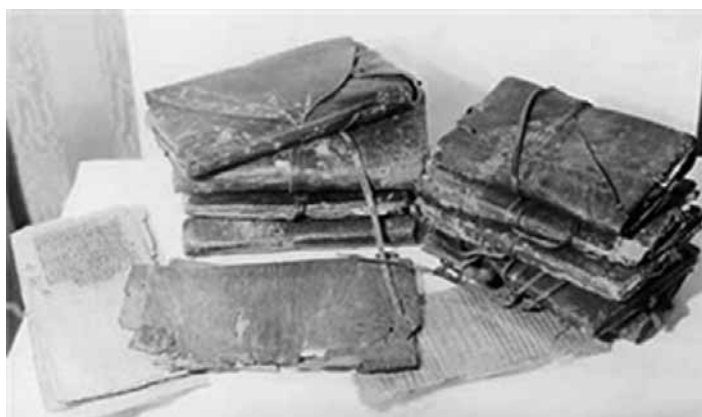
Libro en código.

¿Qué referentes de ambos se pueden encontrar en el libro electrónico? Existen varios formatos de almacenamiento e intercambio de archivos que se utilizan para su lectura, algunos de ellos enlazados al fabricante que los produce, utilizados en algunos dispositivos de lectura específicos. Uno de los más